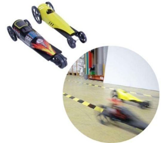
Vérification du fonctionnement avec l'utilisation de l'objet technique

Le contrôle : c'est l'ensemble des opérations de vérification qui permettent de vérifier si l'objet est conforme (bon ou mauvais) par rapport à des critères, des qualités, des performances attendues dans le cahier des charges. Cela peut entraîner l'acceptation, le rejet ou la retouche du produit.